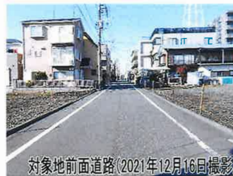
対象地前面道路(2021年12月16日撮影)