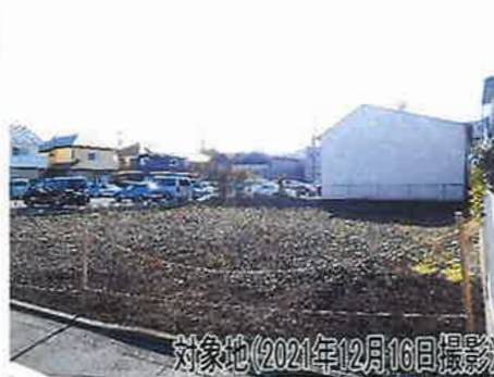
対象地(2021年12月16日撮影)